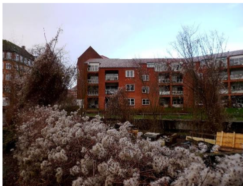
Skovranken i hæk - efterår