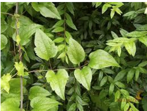
Skovranken i forsommeren

Skovranken , der stammer fra Tyrkiet og Kaukasus, breder sig voldsomt i de senere år. Væksten er invasiv og vil med tiden kvæle træer og buske. Den er samtidig en smuk snerleagtig plante, der i sensommeren er fyldt med små cremehvide blomster, der bliver til hvide fjerlignende frøstande, der lyser op hele vinteren, hver gang der er sol. Mange ukrudtsplanter er bare smukke og gør ingen skade, men lige netop med denne plante er det anderledes, og den er i hastig fremmarch. Heldigvis er den nem at spotte. Som regel kan du se den fra forsommeren, hvor den skyder op ovenpå din hæk som et smukt grønt brus. Følg dens 'lianer', så finder du plantestrengen, der ofte befinder sig midt inde i hækken. Kan du nå ned til roden, klip den af der og træk planen væk nede fra. Og ellers er det bare at trække løs og fjerne alle 'lianer', indtil du kan se plantestrengen. Det er heldigvis virkelig nemt! Allerbedst er det at fjerne planten med rod i marts, da den som en mælkebøtte spreder tusindvis af frø. God arbejdslyst!